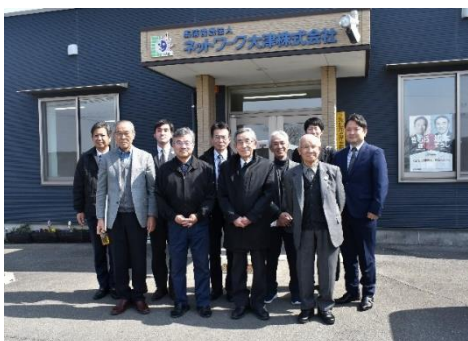
ネットワーク大津株式会社

視察では、2/26（水）に熊本市の農事組合法人すぎかみ農場、2/27（木）に菊池郡大津町のネットワーク大津株式会社を訪問し、法人の概要・特徴・取組などについて説明を受け、その後、質疑・応答を行いました。