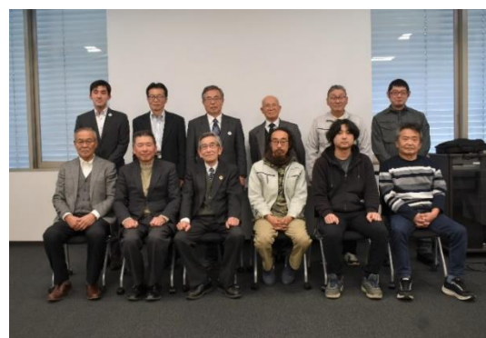
発表法人と協議会役員のみなさん