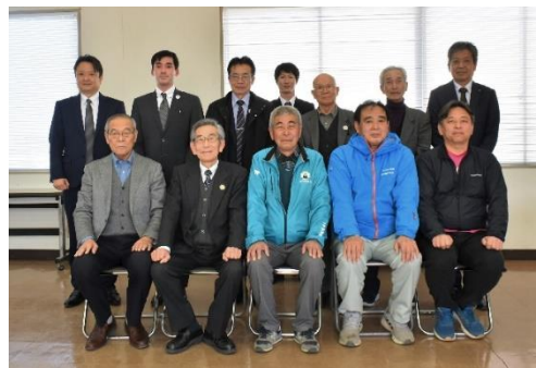
農事組合法人熊本すぎかみ農場

両法人ともに圃場条件の良好な圃場を中心に大規模経営が行われているが、山間部付近の条件不利地や担い手不足・雇用条件など共通する課題について意見交換を行いました。今後の明確なビジョンや経営者視点での考え方などお聞きすることができ実りある視察研修となりました。