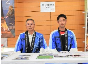
(農) おのじ営農組合