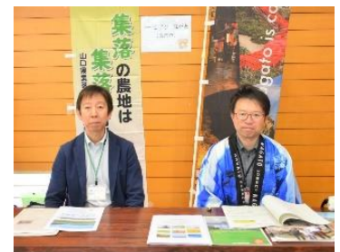
(一社) アグリなごと