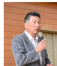
連携協議会 山重副会長