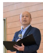
県立農業大学校 福井校長