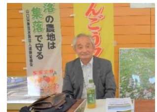
(農) ほんごうファーム