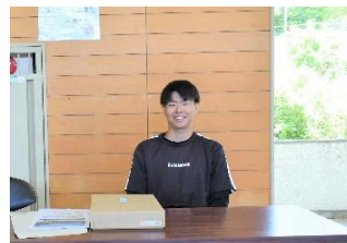
(農) ファームあまだ